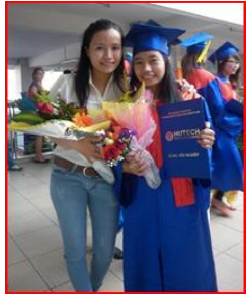
Quỹ CKBV còn cấp dưỡng cho N-L-T, một em mồ-côi cha mẹ đã được ăn học, thi tốt-nghiệp Đại Học đồ Bằng Kế Toán năm 2013 ý ngày 9/12/2012 – cấp vào tháng Giêng năm 2013)