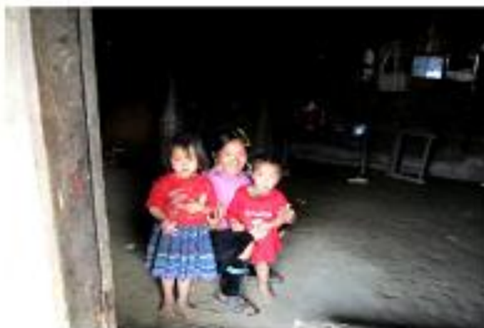
Mẹ và 2 em nhỏ