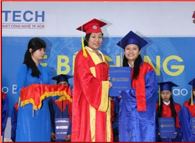
Nhờ sự cấp dưỡng của quỹ CKBV N-L B-T, một em mồ-côi cha mẹ đã được ăn học, thi đỗ Bằng tốt-nghiệp Đại-Học Quản Trị Kinh Doanh (Ký ngày 31/11/2012 – cấp vào tháng Giêng năm 2013)